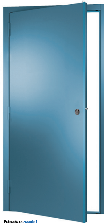
Présenté en croquis 1

Une couche d'apprêt gris ou en option époxy 90 couleurs