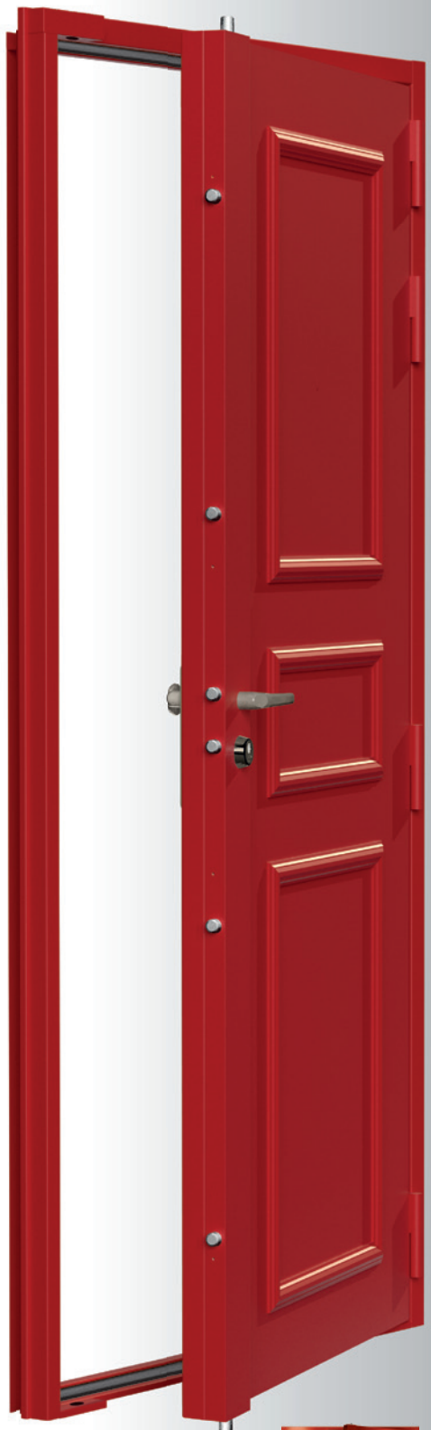
Modèle présenté avec serrure 7 points