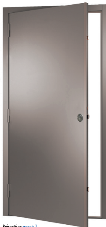
Présenté en croquis 1

Une couche d'apprêt gris ou en option époxy 90 couleurs